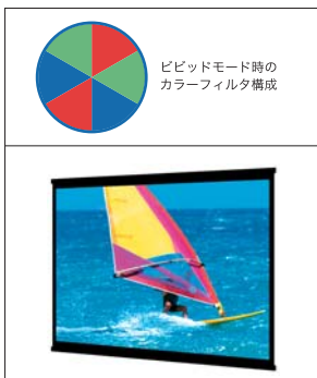
色彩の豊かなデジタル画像やDVDの動画などを自然な画調で投射できる、ビビッドモード。

色優先(ビビッドモード)と輝度優先(ダイナミックモード)を、本体天面のDCMボタンの操作だけで切り替えられる、独自技術DCM(Dual Color Mode)を採用。DLP®方式との相乗効果により、色再現性の高いスムーズな映像を再生できます。