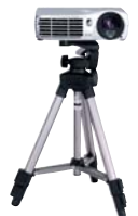
市販の三脚が取り付け可能。

A5サイズ/1.3kgの小型軽量で、1300lmの高輝度。 さらに進化したモバイル性能に加え、カラー再現力が大幅に向上しました。